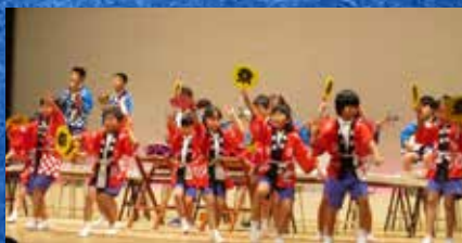
知恵島小学校 演奏発表 (和楽器合奏と阿波踊り)